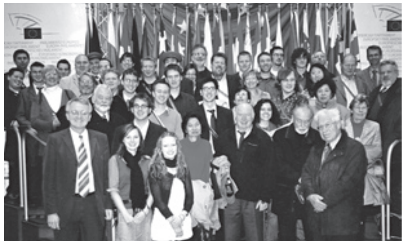
Die Teilnehmer des Symposiums bei der Besichtigung des Europaparlaments in Straßburg mit dem Europa-Abgeordneten Rainer Wieland (vorne links).