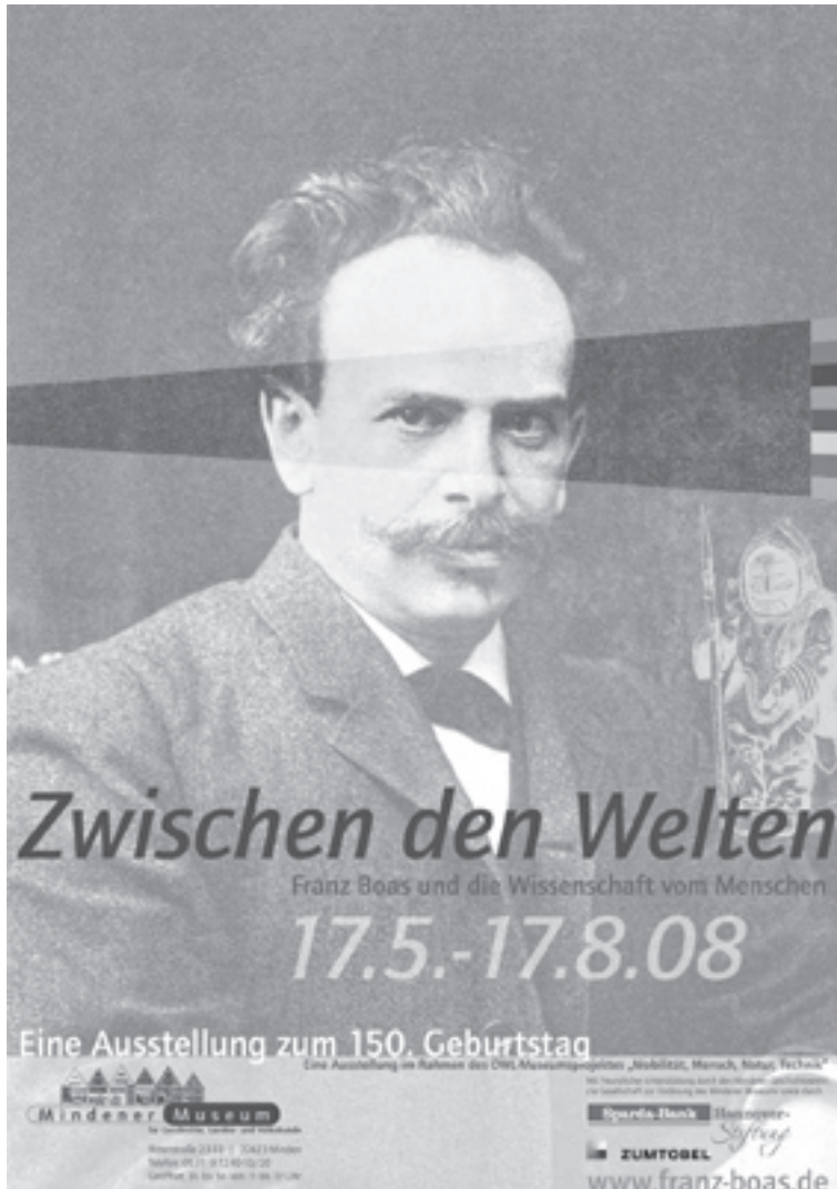
Das Plakat zur Ausstellung über Franz Boas.

Die Stadt Minden feiert im Jahre 2008 das „Franz-Boas-Jahr“, denn am 9. Juli 1858 wurde der berühmte Ethnologe und Anthropologe Franz Uri Boas in der damals preußischen Festung Minden geboren, wo er auch seine Kindheit verbrachte. Der 1887 in die USA ausgewanderte Boas gilt heute als Begründer der amerikanischen Kultur-anthropologie. Er war aber kein unpolitischer Wissenschaftler, sondern äußerte sich vielfach und unerschrocken gegen Rassismus jeglicher Couleur. Außerdem bekannte er sich auch in schwieriger Zeit zu seiner deutschen Herkunft. Seinem Engagement verdanken zahlreiche deutsche Universitäten finanzielle Unterstützung nach dem 1. Weltkrieg.