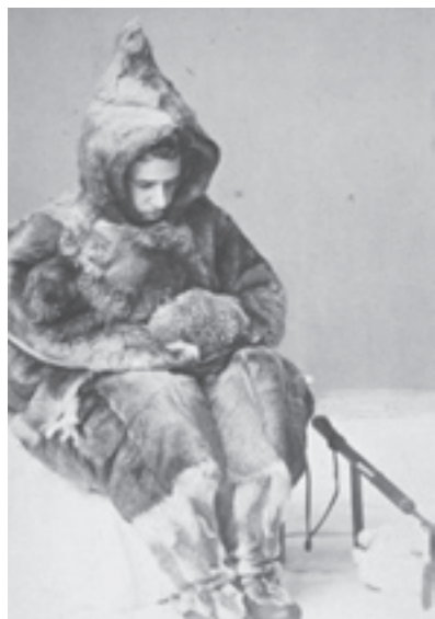
Der Anthropologe Franz Boas in Eskimokleidung um 1886.

Die Ausstellung im Mindener Museum (Ritterstr. 23-33, Minden) wird am Samstag, den 17. Mai 2008 um 16.00 Uhr eröffnet. Sie ist bis zum 17. August 2008 zu sehen: Öffnungszeiten Dienstag bis Sonntag jeweils von 11-17 Uhr; Eintritt 2,- Euro. Im Rahmen des Festprogramms