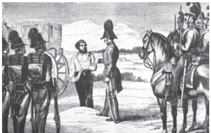
Robert Blum kurz vor seiner standrechtlichen Erschießung am 9. November 1848 in Wien.