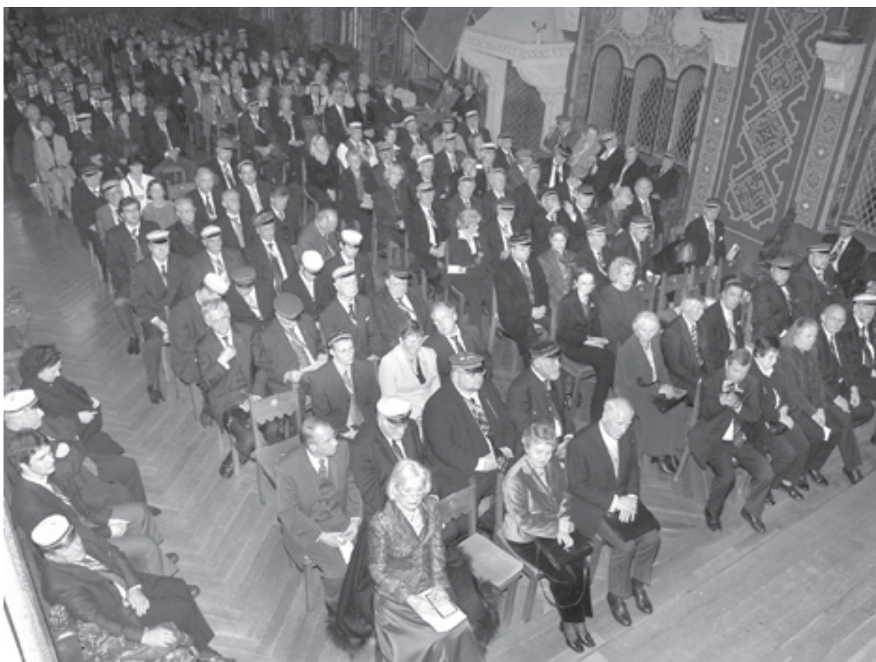
Von der Empore ein Blick auf die Festcorona.