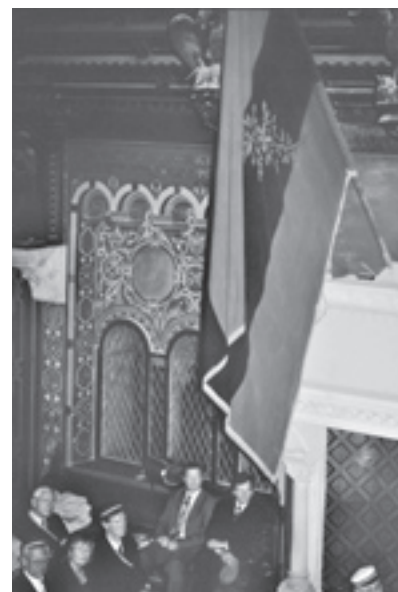
Eine Nachfertigung der Urburschenschaftsfahne hängt im Saal der Wartburg.

„Das Recht, in freier Rede und Schrift seine Meinung über öffentliche Angelegenheiten zu äußern, ist ein unveräußerliches Recht jedes Staatsbürgers.“ Aber lauert nicht hinter jeder freien Meinungsäußerung ein neuer, dienstbeflissener Metternich, der nur darauf wartet, etwas zu finden, wo gar nichts anderes zu finden ist als ein ehrliches Bekenntnis zu einem friedvollen Vaterland, zur deutschen Nation, weil allzu viele nicht mehr in der Lage sind, oder besser, nicht in der Lage sein wollen, eine scharfe Trennungslinie zu ziehen zwischen dem jeder anderen Nation zugestandenem echten bis stolzen Nationalgefühl und einem verhängnisvollen Nationalismus. Da stellt sich doch die Frage, ob sich nicht ein paar Beflissene zusammmentun und eine Sammlung stigmatisierter Wörter und Wendungen dem mündigen Staatsbürger – sei er Politiker oder Kleiner oder beides – in die Hand geben können, um von vornherein peinliche Entschuldigungen und Bußgänge zu unterbinden, und vielleicht ein Vorwort dazu geben, dass ‚vorauselender Gehorsam‘ unter ‚i‘ wie Inszenierung ‚Idomeneo‘ nachzulesen ist. Ich stimme der Pariser Tageszeitung „Le Figaro“ schon zu, wenn sie schreibt: „Die Bundesrepublik Deutschland bietet das sel-