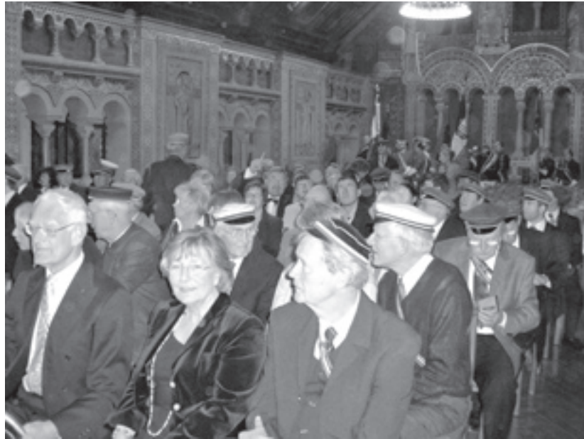
Viele Teilnehmer waren zum Wartburgfest in den Palas der Burg gekommen.

Ich bitte Sie, meine sehr verehrten Damen und Herren, um Verständnis dafür, dass ich noch einmal auf meinen Vater zu sprechen komme, aber vor diesem erlauchten Kreis darf ich es tun, denn mein Vater war, wie die Mutter oft und gern erzählte – ich habe ihn mit knapp fünf Jahren zum letzten Mal gesehen – mein Vater war ein begeisterter und fröhlicher Burschenschafter (was vielleicht eine Tautologie ist); er hat 1939 ein schmales Bändchen herausgegeben unter dem Titel „Glaubensworte für kämpfende Deutsche“. Aha, also ein Nazi, noch schlimmer, ein Pfarrer als Nazi, vielleicht sogar ein deutscher Christ – oh, oh, oh – si tacuisses... [si tacuisses philosophus mansisses = hättest du geschwiegen, wärest du ein Philosoph geblieben, d.h. durch Schweigen kann man seine Unkenntnis verbergen; Anmerkung des Schriftleiters] Aber im Vorwort, das ohne den üblichen Heilsgruß endet, steht: „ Lest bis jedes einzelne dieser Worte ... in Euerem Herzen sitzt, dann mag kommen was will, Trübsal oder Angst oder Verfolgung oder Hunger... “ (5) Wer so etwas laut äußerte, war alles andere als ein „Freund des Führers“, wer so schrieb, wer 1939 von Angst, Trübsal, Hunger sprach, der musste gewärtig sein, wegen Wehrkraftzersetzung vor das Kriegsgericht gestellt zu werden. Und wie viel mehr Verehrung schulden wir den Burschenschäftern, die nicht wie mein Vater und Millionen anderer im Krieg gefallen, sondern die von einem