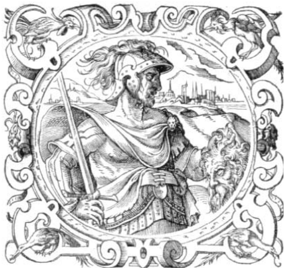
Jost Ammann: Arminius (aus der Chronik des Aventin, 1566), aus: Klaus Kösters, Mythos Arminius. Die Varusschlacht und ihre Folgen, Münster i. W. 2009, S. 67.

9 n. Chr., wurden drei römische Legionen mit Tross und Hilfstruppen unter Publius Quinctilius Varus von einem germanischen Heer unter der Führung des Cheruskerfürsten Arminius vernichtend geschlagen, womit, zumindest nach nicht unbestrittener Meinung einiger Historiker, die deutsche Geschichte eigentlich erst begann. Da die schriftlichen Zeugnisse keine genaue Festlegung zulassen, ist der Ort der Schlacht seit Jahrhunderten heftig umstritten. Seit dem 16. Jahrhundert haben Historiker, Archäologen und Heimatforscher nicht weniger als 700 Theorien zum Ort der Varusschlacht aufgestellt. Aufgrund neuerer Funde seit Ende der 1980er Jahre sind sich die meisten Historiker und Archäologen heute darin einig, dass die Varusschlacht in der Nähe von Kalkriese stattfand, heute ein Stadtteil von Bramsche im Landkreis Osnabrück.