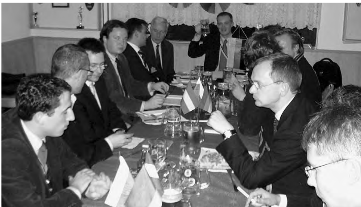
Nikolauskneipe im Dezember 2008.